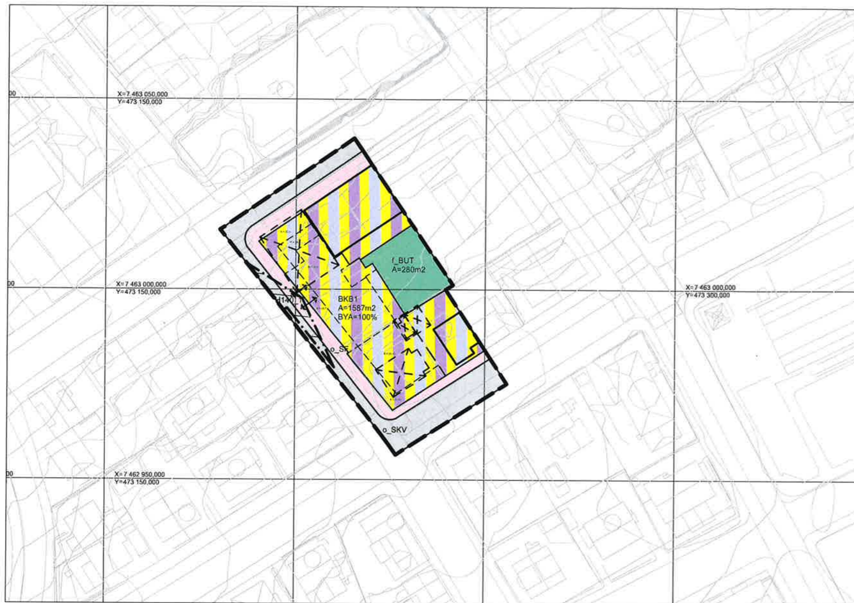
VERTIKALNIVÅ 2 - PÅ GRUNNEN 1:1000/A3